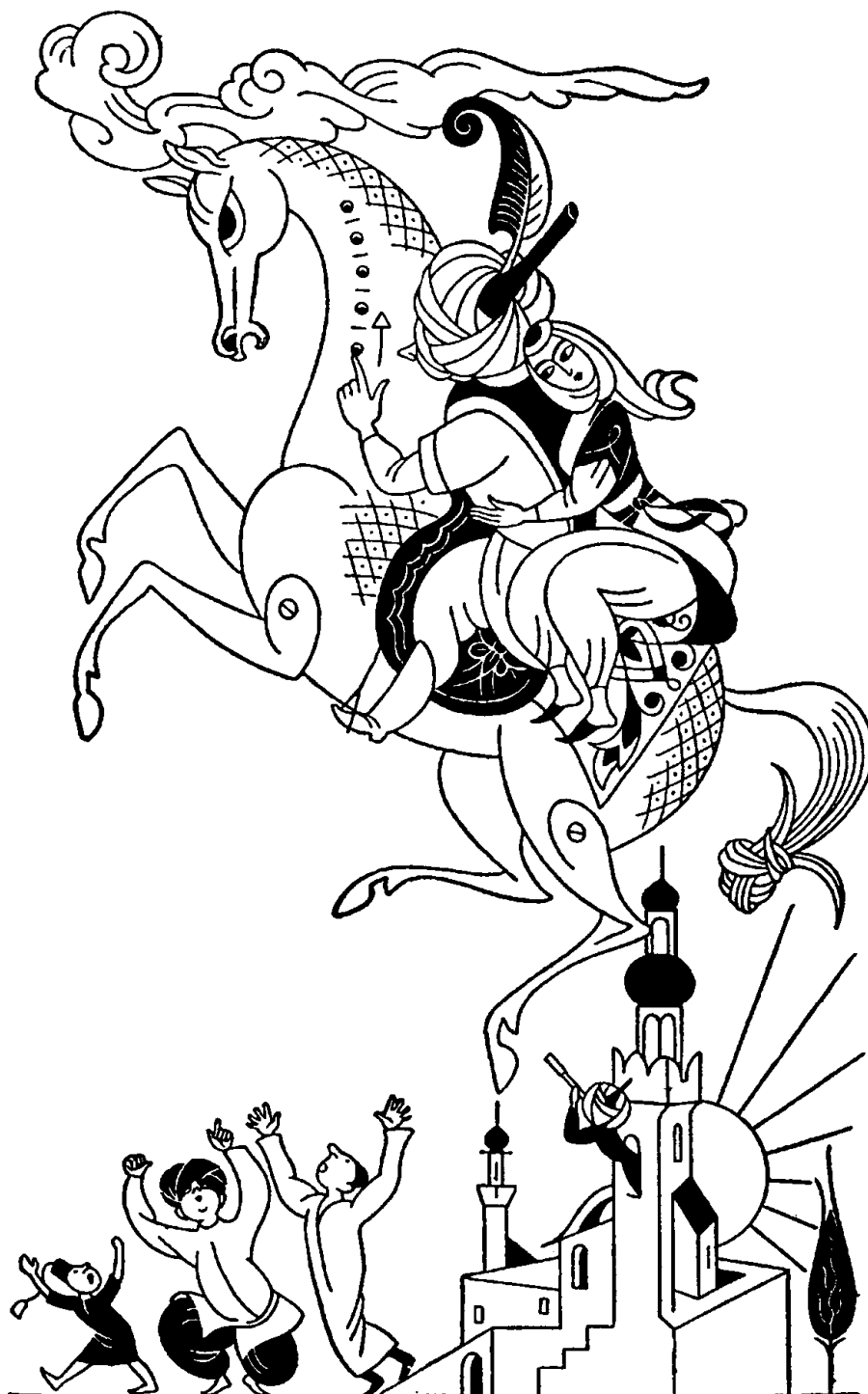
تصویر خیالی اسب افسونگر که به نظر می‌رسد از افسانه معراج محمد بن عبدالله واقعی‌تر باشد. به مطالب همین فصل و به ویژه صفحه‌های ۲۹۹ به بعد مراجعه فرمایید.